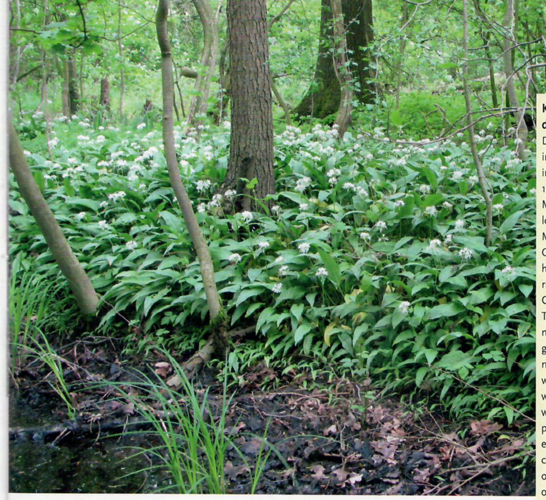
Foto 1. Rabat begroeid met Daslook. In 1976 was de oppervlakte ca. 10 m², in mei 2015 is de oppervlakte toegenomen tot ca. 750 m² en beslaat vijf rabatten.